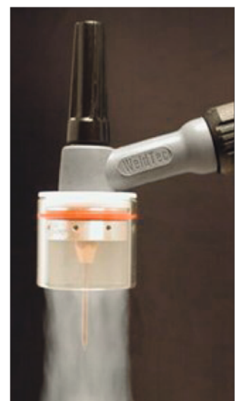
flusso de gas 14,158 l/min